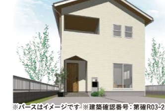
※パースはイメージです※建築確認番号:第確R03-2474