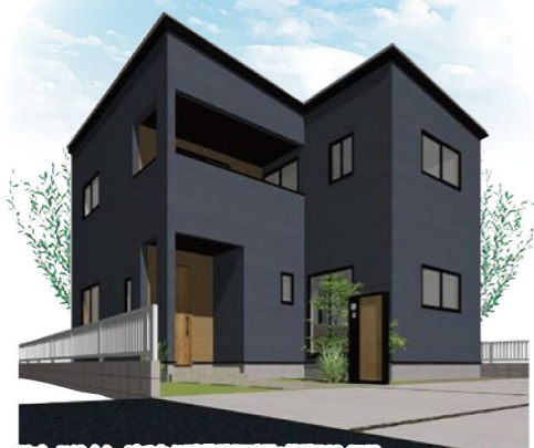
※パースはイメージです※建築確認番号:第確R03-2562

2階は各部屋の収納+ 廊下にある納戸が 収納力抜群で便利! お部屋や廊下がすっきり!