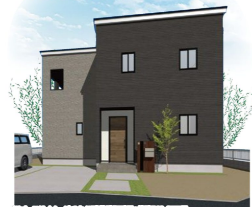
※パースはイメージです※建築確認番号:第確R03-2555号

2階の廊下には 使い勝手の良い手洗い! 手洗いの習慣化や掃除など 様々なシーンで便利です。