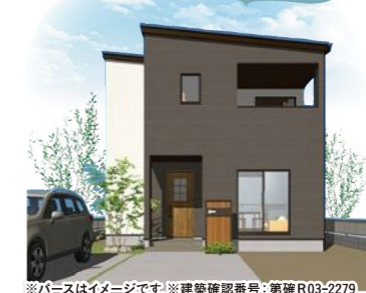
※パースはイメージです※建築確認番号:第確R03-2279