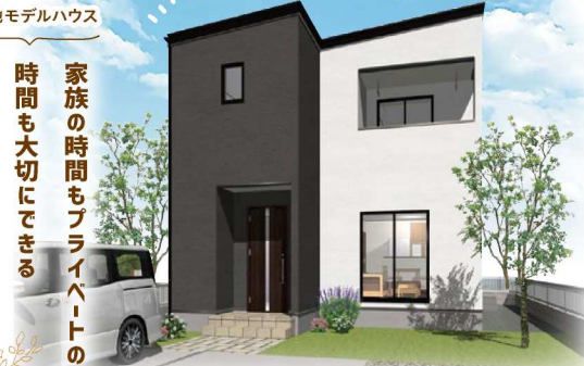
※パースはイメージです。※建築確認番号:第630号

3LDK ■土地面積/168.60㎡(51.00坪) ■延床面積/97.29㎡(29.43坪)