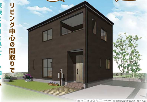
※パースはイメージです。※建築確認番号:第16号