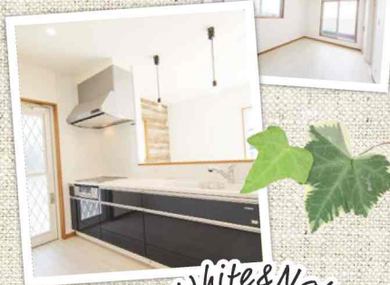
White & Natural