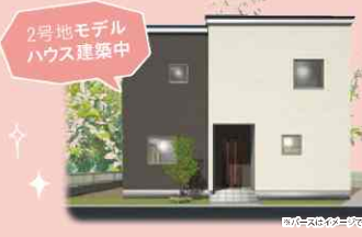
2号地モデルハウス建築中