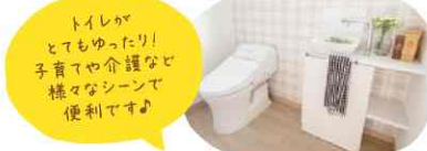
トイレがとてもしっかり子育てや介護など様々なシーンで便利です!