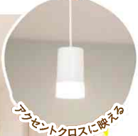
アクセントクロスに映える

01 アクセントクロスが可愛いLDK ナチュラル×アクセントクロスで大人可愛い空間!