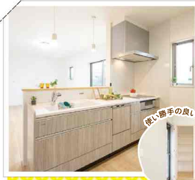
使い勝手の良い収納

収納たっぷりのママに嬉しいゆったりキッチン。キッチン横には収納スペースも完備! 毎日使う場所だから、便利なこだわりがたくさん!